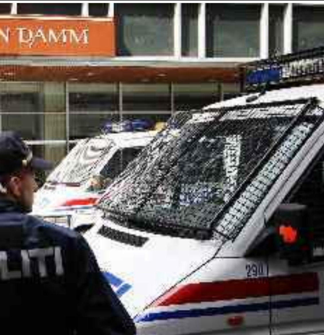
tt tidligere denne uka. De varslede demonstrasjonene uteble.